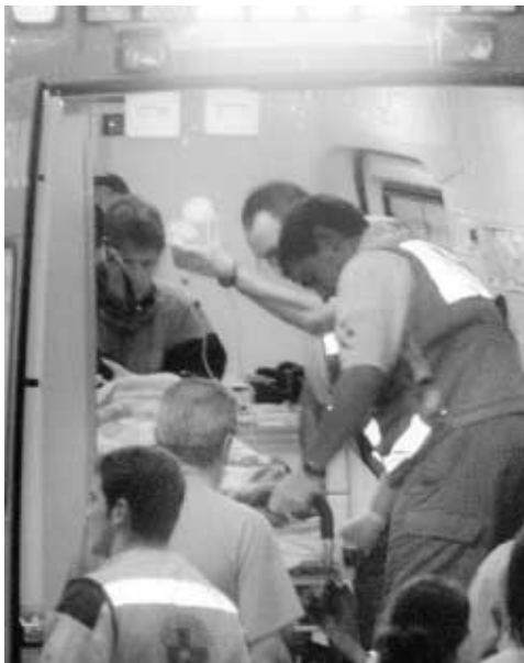
Momento en que uno de los dos agentes es atendido en una ambulancia

El atentado tuvo lugar a las 00,40 horas, cuando los dos agentes, que