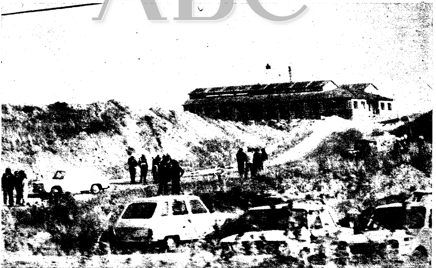
La Policía Militar controla los accesos al acuartelamiento donde se ha celebrado el Consejo de Guerra, en Burgos.