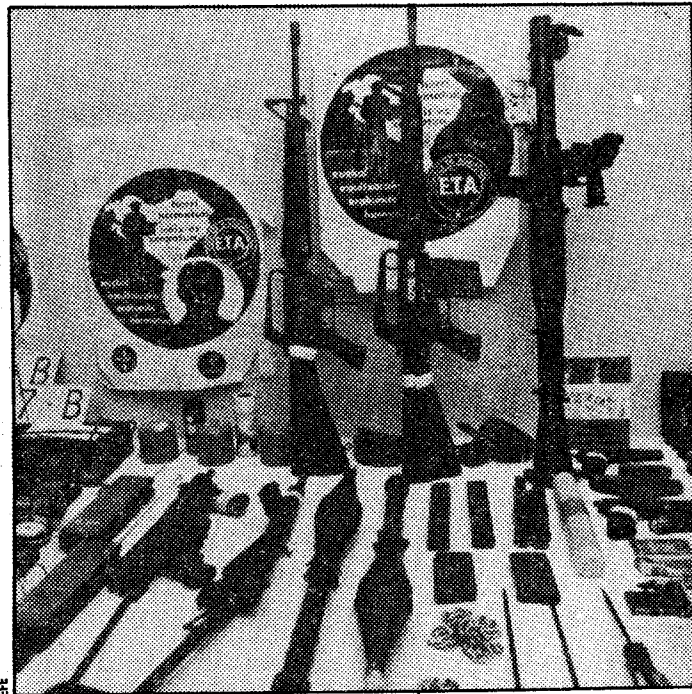
Moderno armamento incautado a los etarras, en el que destaca un lanzagranadas

Finalmente, el tercer comando estaba formado por personas que vivían legalmente encargadas de tareas de información bajo el nombre de "Gau Txori" (Pájaro de la Noche), de ETA-M. En su aspecto informativo, habrían realizado labores de seguimiento a personas y sobre lugares objetivos de posteriores acciones operativas, entre otras: cuartel de la Guardia Civil de Tolosa. Servicios, horarios, itinerarios de patrullas, etcétera. Entidades bancarias de la zona. Supuestos informadores de los Cuerpos y fuerzas de seguridad del Estado. Traficantes y