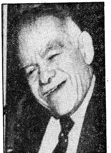
Shamir sufrió un accidente de tráfico sin consecuencias